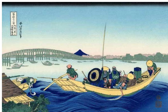
葛飾北斎「富嶽三十六景 御厩川岸より両国橋夕陽見」